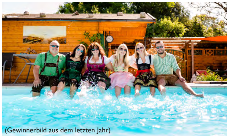
(Gewinnerbild aus dem letzten Jahr)

Teilnahmeberechtigt sind Kunden der Desjoyaux Pools Freising GmbH.